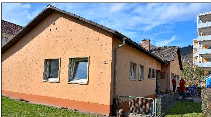
Der neue Treffpunkt in Kollnau nimmt allmählich Gestalt an.

Waldkirch-Kollnau (db). Am letzten Samstag öffnete das ehemalige AWO-Stüble in Kollnau als „neuer Treffpunkt“ seine Türen und der immense Besucherandrang überraschte alle Beteiligten positiv.