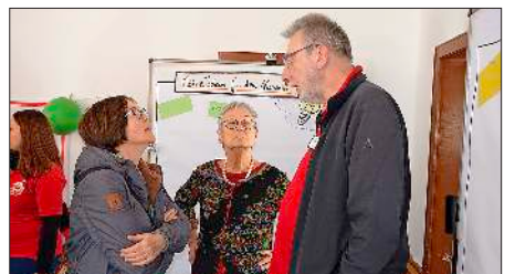
Neue Ideen für den Kollnauer Treffpunkt sind gefragt. Alle sozial in der Stadt engagierten Menschen gab sich am Samstag ein Stelldichein.